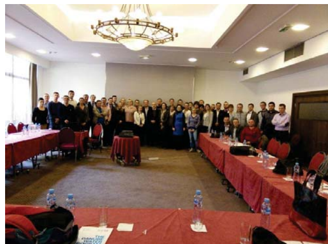
Grupni foto sa Druge radionice

Druga radionica održana je 3. novembra u Beogradu, RS, sa predstavnicima IAWD (Kling, Weller, Wagner i Wolff) i uz prisustvo 16 vodovoda, tj. ukupno 43 učesnika.