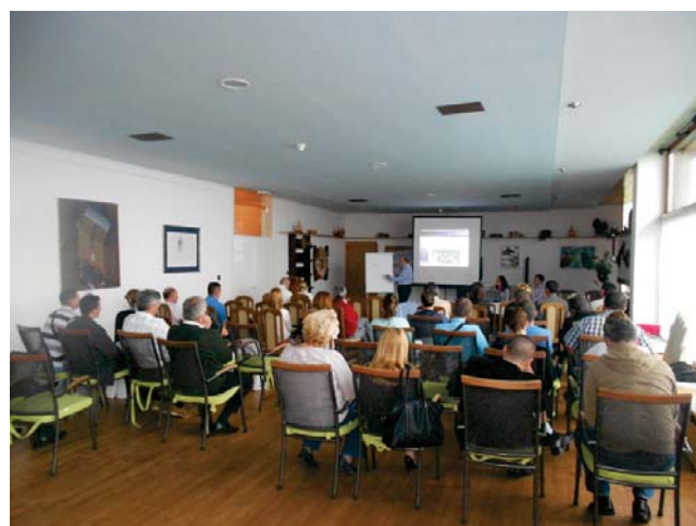
Radna atmosfera sa Prve radionice